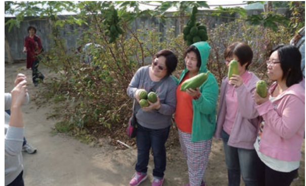
回收水再利用，一起同樂採果趣