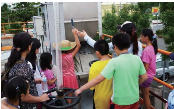
來看看機械式攔污柵會攔截到什麼東西呢？