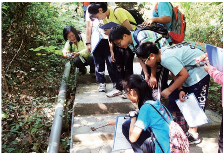
觀察臺灣獼猴的排遺

壽山國家自然公園成立於民國100年，是首座由下而上由民間推動的國家自然公園，也是鄰近高雄都會區的重要自然場域。它擁有獨特的高位珊瑚礁地質地形、豐富的動植物資源及珍貴的史前貝塚遺跡。為了讓更多人深入了解壽山地區的自然與人文資源，壽山國家自然公園成立了淺山學堂，規劃多種特色課程，期能讓來參與的民眾了解壽山、愛護壽山。