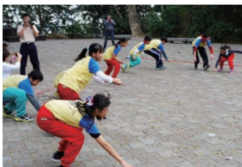
真相搜查隊—從遊戲中學到多線南蜥對原生種蜥蜴的影響